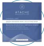
GREEN SEAWEED BODY SCULPTING MASK

Verter el contenido de dos sobres de GREEN SEAWAD BODY SCULPTING 6 en un bol y oxigenar con una espátula o varilla, añadir aproximadamente 180ml de agua (90ml por sobre), preferentemente mineral.