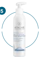
CELLU ATTACK BODY SCULPTOR

Para finalizar, aplicar mediante un ligero y suave masaje CELLU ATTACK BODY SCULPTOR 5 , en toda la zona tratada hasta su completa absorción.